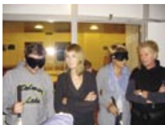
Ervaren hoe het voelt om niets te zien.