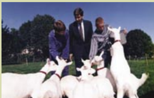
De Gouverneur op bezoek